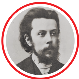
Modest Mussorgsky 1865 © Fine Art Images

kollegen vorstellte, fiel das Urteil ernüchternd aus. Besonders Mili Balakirew, sogar Widmungsträger der Komposition, äußerte sich über die nervösen, überreizten, dräuenden und zerrissenen Klänge dieses düsteren