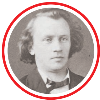
Johannes Brahms, ca. 1868

nötige Aufmerksamkeit garantiert. Das wusste auch Johannes Brahms – und es wurmte ihn. Von Haus aus Pianist, hatte er mit dem Handling eines ganzen Orchesters zunächst seine Schwierigkeiten.