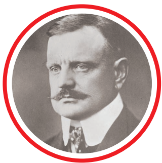
Jean Sibelius, 1913

Zeit seines Lebens haderte Sibelius damit, nicht die volle Anerkennung als Sinfoniker zu haben und reduziert zu sein auf das Attribut „Nationalkomponist“, das er doch zu Beginn seiner Karriere mit patriotischen Werken wie Finlandia selbst zementiert hatte. Auch