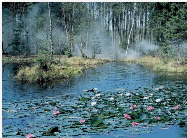
Inspiration für Dvořáks Sinfonie Nr. 8: Landschaft bei Vysoká u Píbramě

tonmotiv fortissimo in den Hörnern, Akkordbrechungen im Klavier und vollgriffige Kaskaden mit Viertongriffen in jeder Hand. Dieser Einstieg wurde fast so bekannt wie der zu Beethovens fünfter Sinfonie. Dass ukrainische Volkslieder und (im zweiten Satz) ein französisches Chanson melodisches Material von größtem Reiz liefern, sollte aber nicht vergessen werden – schließlich sind die lyrischen Anteile dieses Kraftkonzerts nicht minder bemerkenswert. „Viel Poesie“, das hatte ja Tschaikowsky selbst attestiert.