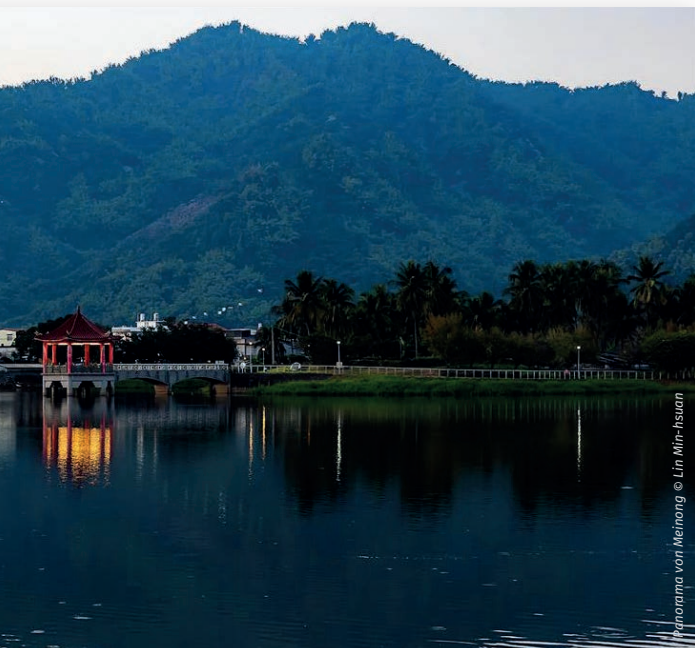
Panorama von Meinong

beruht auf einem Kontrast von Tradition und Moderne: Der Sprechgesang der Hakka-Sprache, der Schlagzeug-Rhythmus der für die Volksmusik der Hakka typischen Instrumentalensembles, ihre Berglieder und ihre Lieder beim Teeplücken bilden hier das musikalische Material. Die Rhythmen und Melodien treten in einen Dialog mit dem die Industrialisierung symbolisierenden Orchesterklang und betonen die traditionsverhaftete Lebensweise des Hakka-Volks. Der letzte Satz, „The Song of Life“, verwendet die Hakka-Ballade Niong cin t'u tsü ko , die von der Erziehung eines Kindes durch die Mutter erzählt. Die allmähliche Entfaltung und variierte Wiederholung dieser musikalischen Elemente bringt die besondere Bedeutung ökologischer Fragen für die Bewohner von Meinong und ihre Achtung vor der Natur zum Ausdruck. Tao of Meinong ist ein Auftragswerk des taiwanischen Rats für Hakka-Angelegenheiten und des Taiwan Philharmonic und wurde 2022 unter der Leitung von Mei-Ann Chen in Taiwan uraufgeführt.