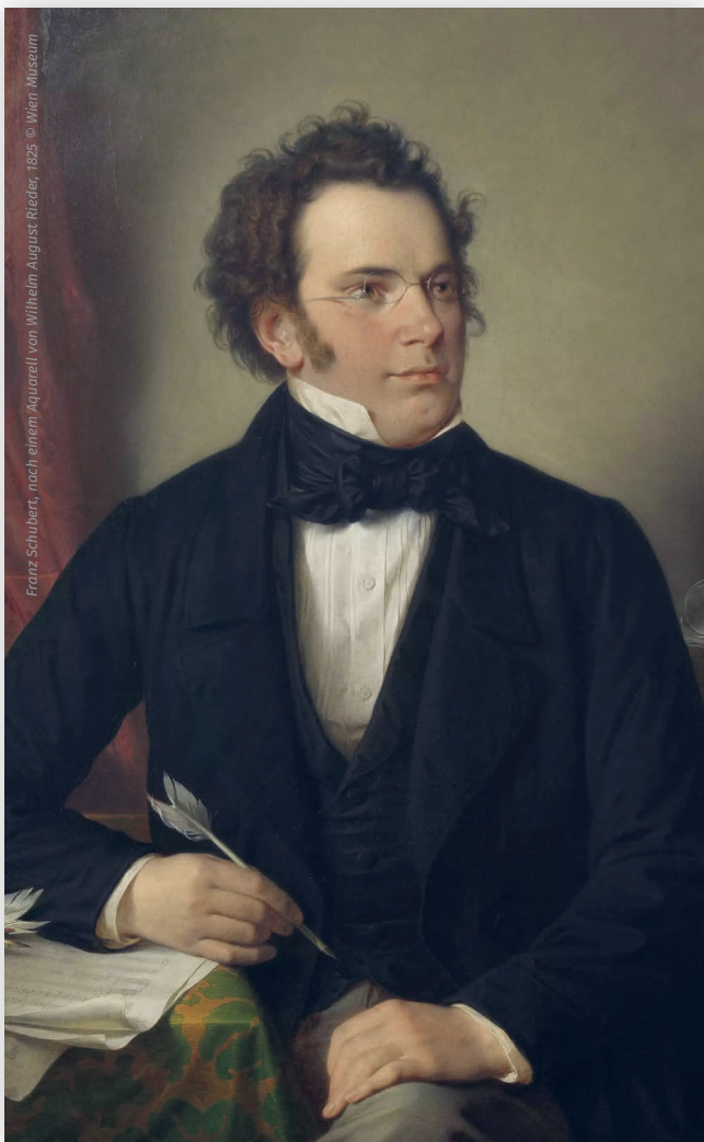
Franz Schubert, nach einem Aquarell von Wilhelm August Rieder, 1825